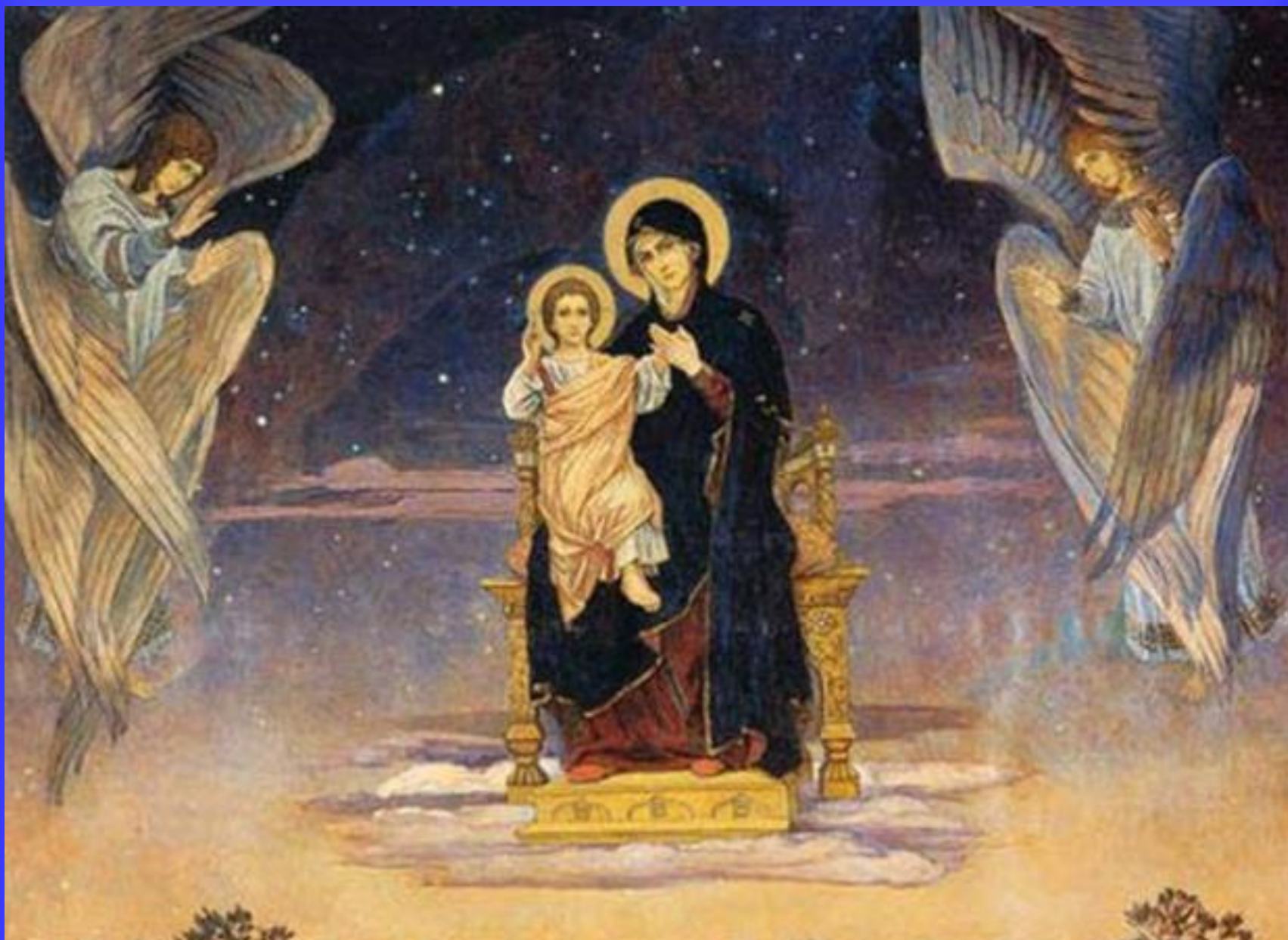
Васнецов “Богоматір з Немовлям і янголами”.