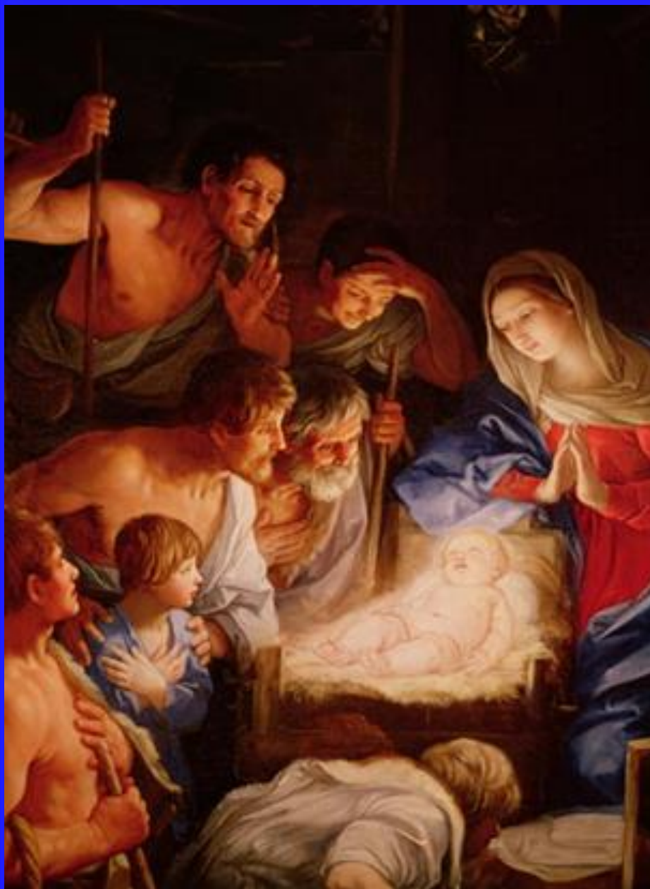
“Поклоніння пастухів” Гвідо Рені