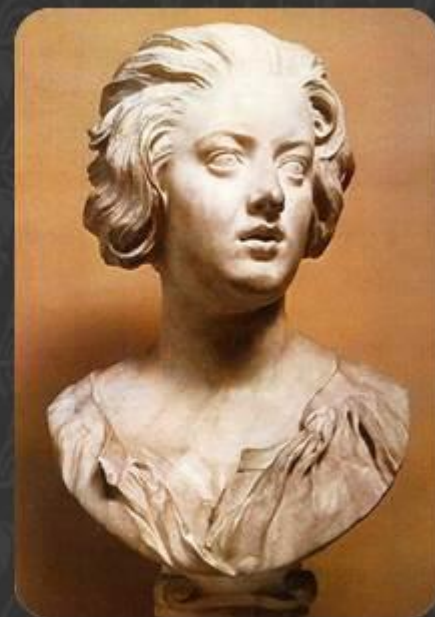
Портрет Констанцы Буонарелли (1635)