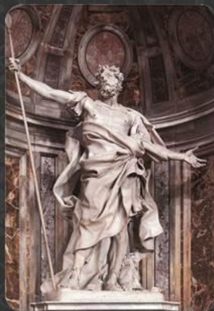
«Святой Лонгин» (1629—1638) в соборе Святого Петра